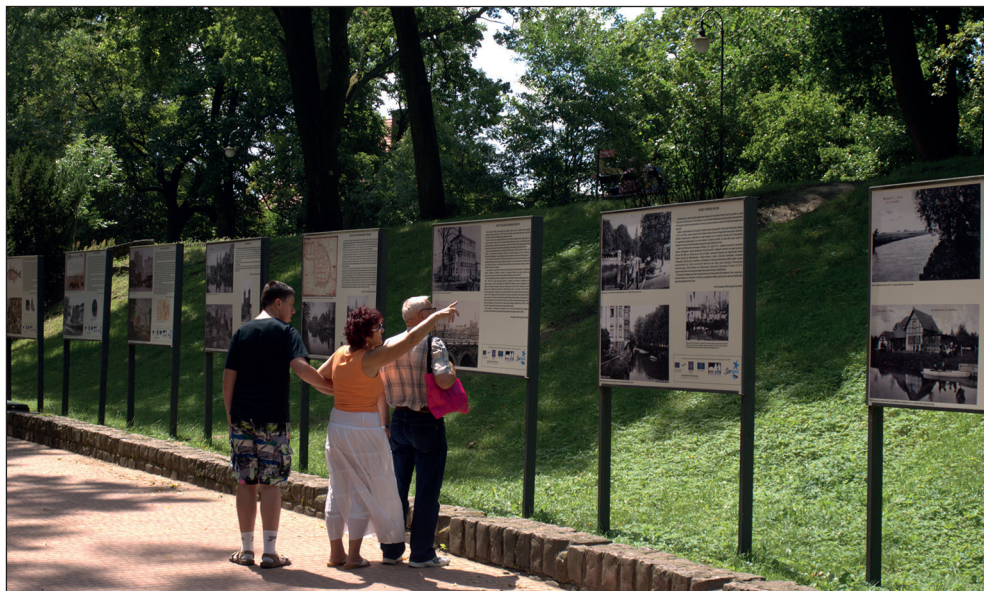
Ryc. 9. Wystawa plenerowa Stalag II D w parku Bolesława Chrobrego.