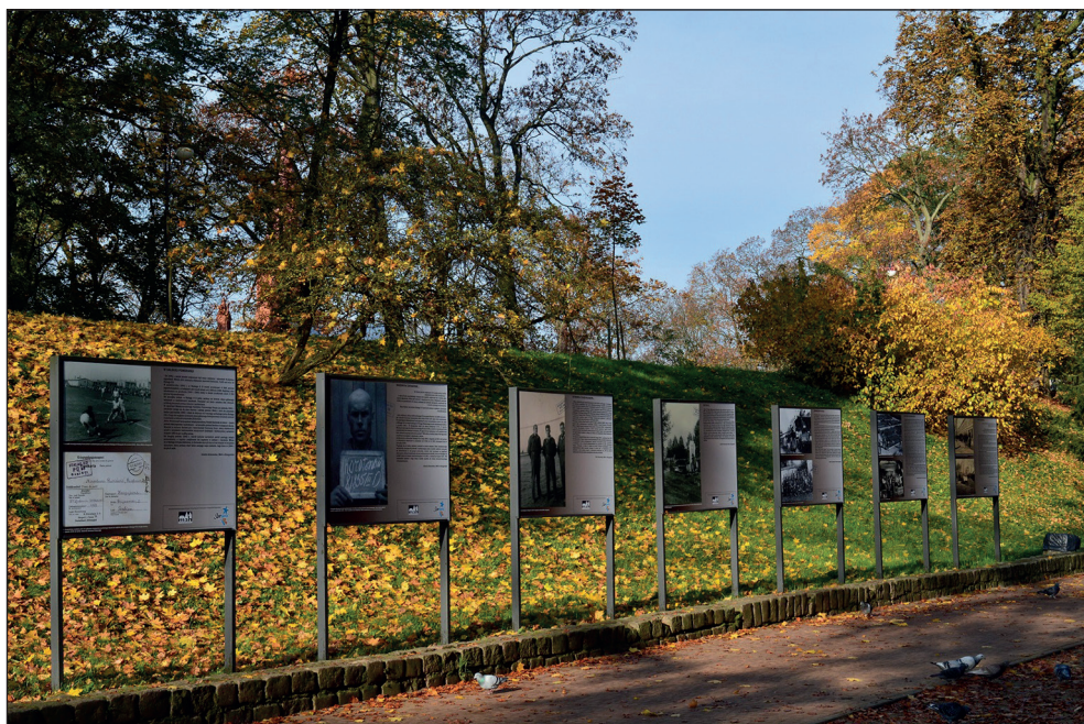
Ryc. 10. Wystawa plenerowa Stargard – miasto nad Iną w parku Bolesława Chrobrego.