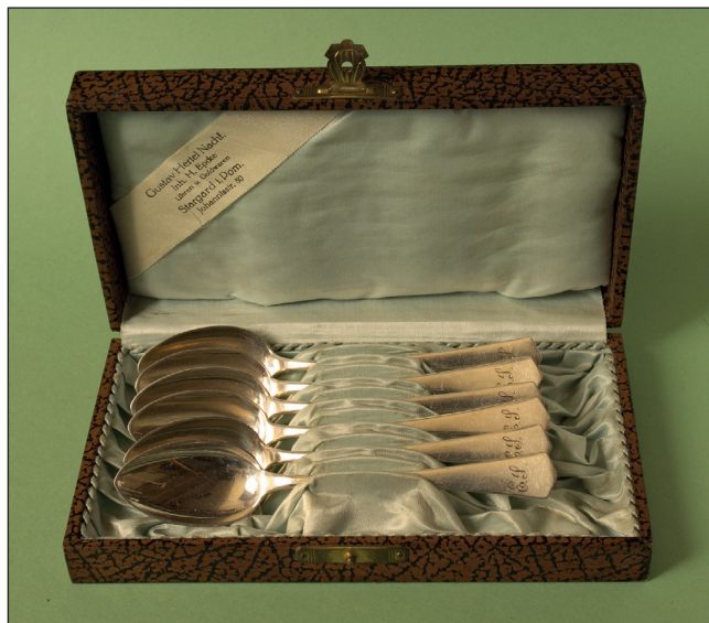
Ryc. 4. Komplet łyżeczek z lat 20. XX w. w oryginalnym etui z zakładu zegarmistrzowskiego i złotniczego Hugo Epcke ze Stargardu. Zbiory MAH w Stargardzie, nr inw. MS/S/1169.