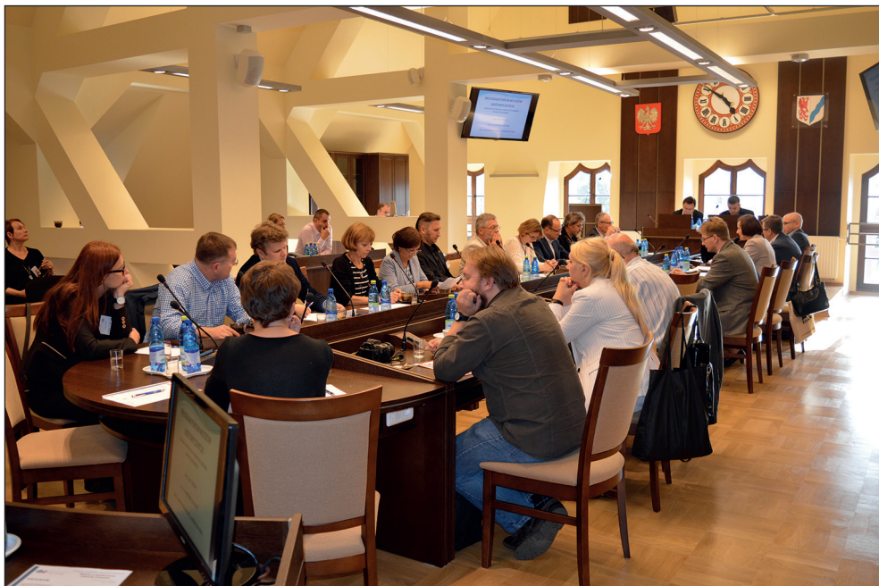
Ryc. 11. „Forum Muzeów Historycznych” w Stargardzie pt. Historia a współczesne narracje muzealne – 17 września 2014 r., sala obrad Rady Miejskiej w stargardzkim Ratuszu.