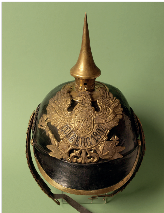
Ryc. 3. Pikielhauba stacjonującego w Stargardzie 9. (2. Pomorskiego) Kolobrzeskiego Pułku Grenadierów im. hrabiego Gneisenau. Zbiory MAH w Stargardzie, nr inw. MS/S/1187.