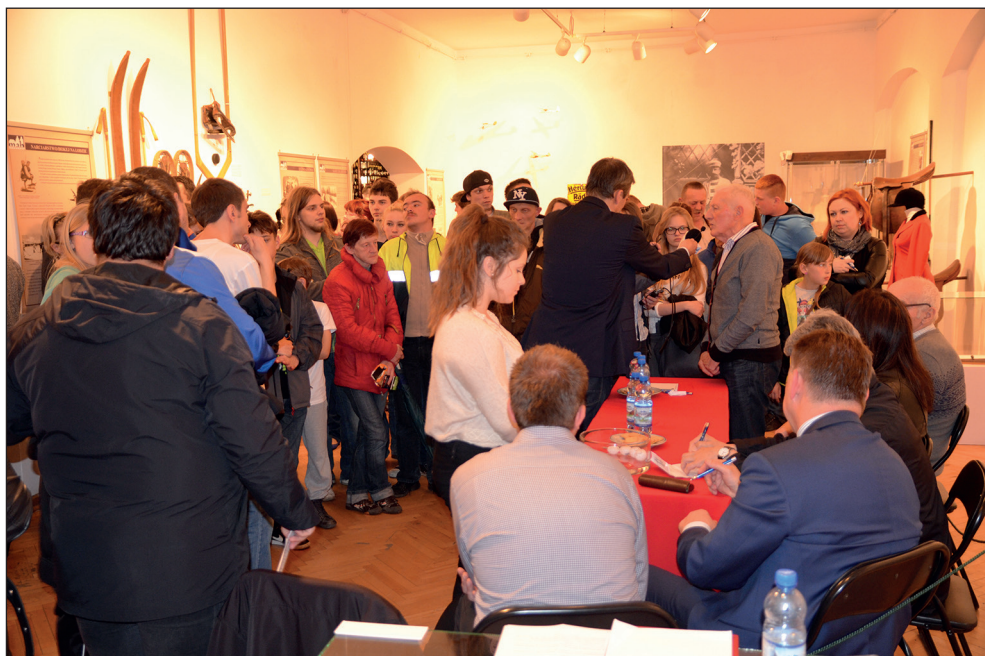
Ryc. 8. „Noc Muzeów” 2014 w klimacie sportowym. Jedną z atrakcji było spotkanie z dawnymi, znanymi stargardzkimi sportowcami.