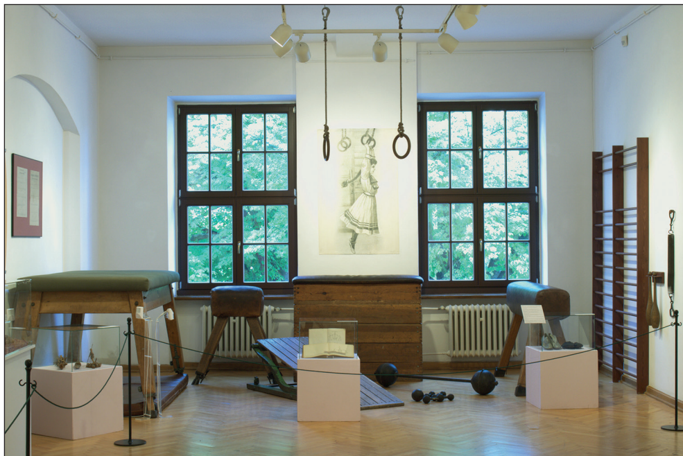
Ryc. 7. Wystawa czasowa W zdrowym ciele zdrowy duch. Sport modny nie od dziś z zaaranżowaną salą gimnastyczną.