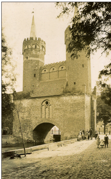
Ryc. 5. Fotografia Bramy Młyńskiej, ok. 1900-1920.