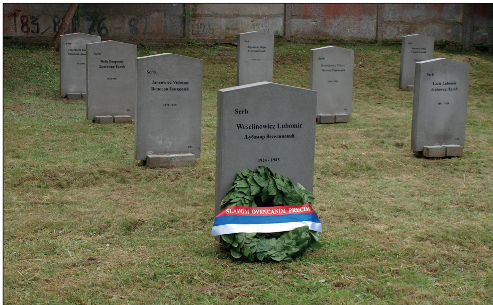
Ryc. 13. Upamiętnienie serbskich jeńców wojennych, Międzynarodowy Cmentarz Wojenny w Stargardzie, 29 maj 2014 r.